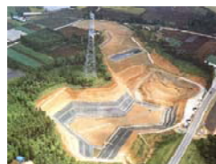
大木戸最終処分場

エコパークゴルフ大木戸は、当社の徹底した品質管理のもと、適正に処理・管理した産業廃棄物を埋立してきた安定型最終処分場の跡地を利用した本州初のパークゴルフ場です。本格的な4つのコース(全36ホール)は、初心者から経験者の方まで幅広くお楽しみいただけます。